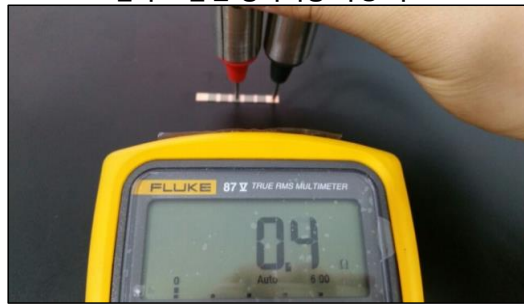
점착 도금면 상하저항 측정